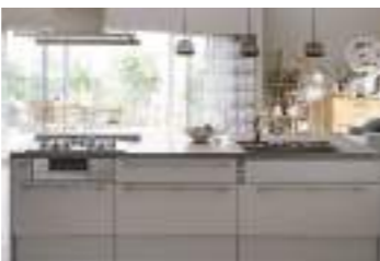
キッチンリフォーム