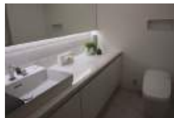
トイレリフォーム