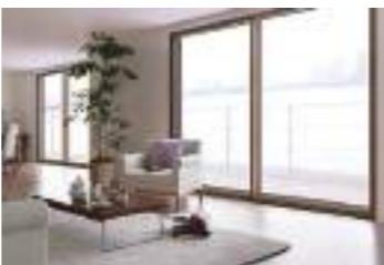
窓断熱リフォーム