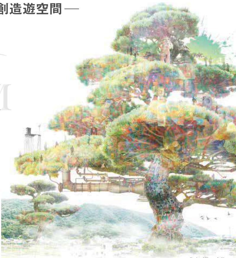
Design / Kitamado Yuta