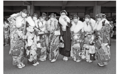
二十歳の集いのようす

1月9日には「二十歳の集い」も開催し、皆さまをお祝いしました。つつい「成人の日」と言ってしまうようになりますが、成年年齢が引き下げられた後も本市では二十歳の節目を迎える皆さまをお祝いしています。今年度は1,059人の皆さまが二十歳を迎えられます。若さ溢れる活気に満ちた姿を拝見し、それぞれが夢や目標に向かって努力されておられると思えました。大きな可能性を持つ皆さまが、今年の干支（えと）である「うさぎ」のように飛躍されることを祈念いたします。