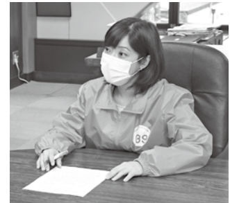
市長がオレンジジャケットを着用してPR