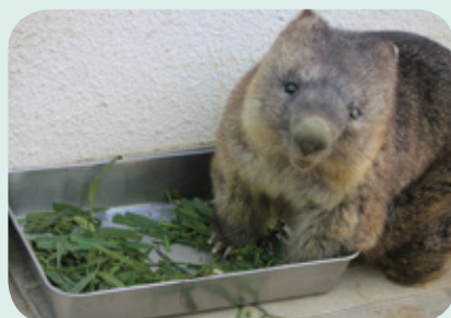
史上最高齢の飼育されたウォンバット (oldest wombat in captivity ever)