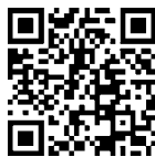
アプリダウンロード

阪急沿線を中心に広域観光を進めるため、ウォーキングアプリ「aruku」に観光コースを掲載しています。コースを踏破すると応募カードが入手でき、自治体が設定した景品に応募することができます。ダウンロードして、日々のお出掛けに役立ててください。 問 空港・観光課 ☎754・6244