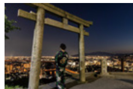
昨年の池田市長賞

主催・問合せ・作品受付 いけだ市民文化振興財団・池田市観光協会 ☎750・3333