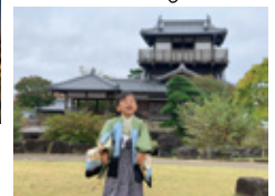
昨年のスマートフォン賞