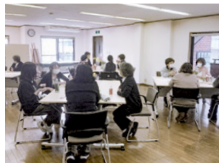
オレンジカフェの様子

利用者から「ゆっくり話ができて良かった！」と言ってもらえるカフェをめざして、オレンジパートナーや医療・介護などの専門スタッフがお待ちしています。