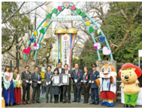
2月11日、「ワイン」の世界最高齢更新記念式典とお祝いイベントを開催