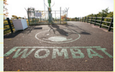
おそらく最も空に近いウォンバット。