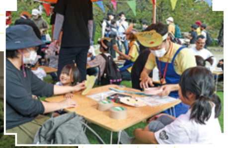
昨年10月22日に開催された「ウオンバットの日2022」の様子