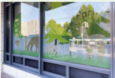
きれいに撮るのは至難の業…。