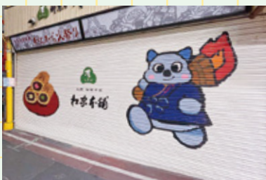
過去に地元のボランティアが描いた優しいイラストも市内に点在。