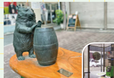
動物園に向かう途中のおなじみの存在です。