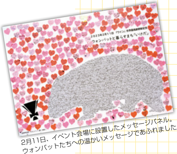
2月11日、イベント会場に設置したメッセージパネル。ウオンバットたちへの温かいメッセージであふれました

に愛されていることを改めて実感した1年でした。そして今年「ワイン」がさらに年齢を重ね、晴れて世界最高齢を更新しました。寝ている時間が長くなるなど多少年齢を感じることはありませんが、人懐っこい性格を存分に発揮して、今も元気に歩き回っています。これからも「ウオンバットと暮らすまちいけだ」を合言葉に、ウオンバットと池田のまちの魅力向上に取り組みます。