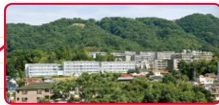
●五月丘小学校区の人口：6,799人 (令和5年4月30日現在)