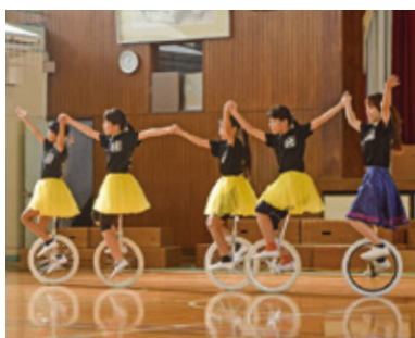
秦野小学校体育館で行われた「あおぞら de はたのフェスタ」のようす。

子どもたちの秦野に対する 愛着と誇りを 歴史ゆかしい秦野地域では伝統 行事が盛んです。夏は畑天満宮の