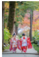
昨年の池田市長賞