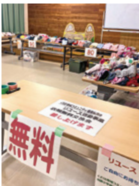
リユース活動 (子ども服無料交換会)

私たち協議会は1年を通じてさ まざまな取り組みを行っています。 中でも特に地域の皆さんのご協力 で成り立っているのが「子ども服無 料交換会」と銘打ったリユース活動 です。これは、お子さんが大きく なってもう着られなくなった服を 各ご家庭から提供いただき、必要 な方にお持ち帰りいただくという