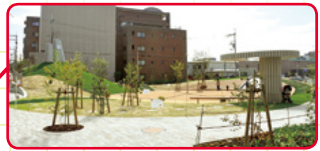
● 呉服小学校区の人口：11,961人 (令和5年6月30日現在)