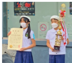
呉服小学校吹奏楽部への支援

呉服小学 校には75年 の歴史と伝 統を誇る吹 奏楽部があ り、地域に は吹奏楽 部のOB・OGが大勢いて、み んなで子どもたちの活動を温かく見 守っています。1970年の大阪 万博でも演奏したこの吹奏楽部は、 全日本小学生バンドフェスティバ ルで、昨年、一昨年と2年連続の 金賞を受賞しました。本協議会も 微力ながら応援を続けています。