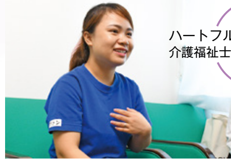
ハートフルふしお 介護福祉士