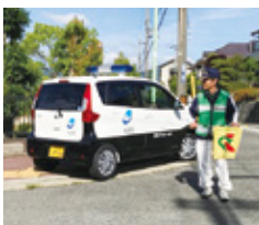
伏尾台安全パトロール隊

最初に取り組んだ事業のひとつが「伏尾台安全パトロール隊」、通称「青パト」です。青色回転灯を装備したパトロールカーでの巡回はもちろん、朝は通学路の見守りを行っています。現在、隊員は43人ほど。もちろん皆さん、地域住民の方々です。