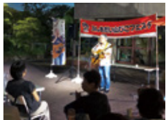
ふしおだい山びこフェスタ

まちににぎわいを創出したいと始めた「ふしおだい山びこフェスタ」は現在、年に4回ほど開催していて、もう40回を超えました。コミプラや旧伏尾台小学校「はぐのさと」を会場に、落語家やミュージシャンの方をお招きしてライブを行っています。子どもも大人もみんな笑顔です。