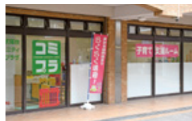
伏尾台コミュニティプラザ