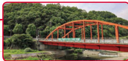
●伏尾台小学校区の人口：4,903人 (令和5年9月30日現在)