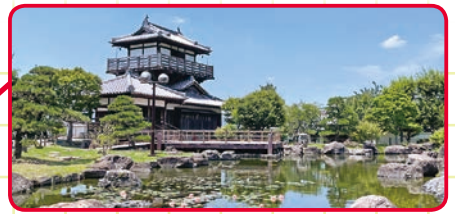
●池田小学校区の人口：14,552人 (令和5年10月31日現在)