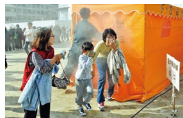
合同防災訓練の様子

支えてくれています。 本協議会では他にも地域の教育支援や交通安全対策など、さまざまな事業に取り組んでおり、この秋には地域全体の防災訓練も実施します。池田小学校区は14の自治会全てに自主防災組織があり、それらが一致団結して行う合同訓練です。自分たちのまちを自分たちで守る、自分たちで良くしていく。まちづくりに力を貸してください。仲間を募集中です！