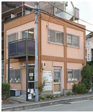
ちいさな絵本館(菅原町10-14)の外観

地域の声から生まれた「ちいさな絵本館」 池田地域は阪急池田駅があり、住宅や商店も多く、国道や府道が通り、そして猪名川が流れていきます。ここは交通の便が良く、自然にも恵まれた地域で、老若男女が暮らしています。 本協議会の設立当初、まちに関するアンケートを住民の皆さんへお願いしたところ、「図書館が近くにない」という意見が散見されました。今は呉服町に立派な市立図書館がありますが、以前は五月丘にあって、このまちからは少し遠かったのです。小規模なら私たちにもできるのではと、会員のみんなで場所を探し、市に陳情し、本を持ち寄って始めたのが、この