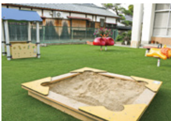
新たに人工芝を敷いた芝生広場

各事業は一定の成果を収めています。子育て支援と高齢者支援にも注力 今年、神田地域で活動している各種団体の代表者にお集まりいただき、座談会を開催しました。みんなでビジョンを話し合い、「安全・安心・美化」と並行して今後さらに注力する取り組みを確認したところでした。 一つは子育て支援。その一環として、市の共同利用施設である神田会館の中に「絵本の小部屋」をつくりました。会館前の公園も小さなお子さんが安心して遊べるような人工芝を敷いて改装中です。どうぞお楽しみに。 もう一つは高齢者の支援。この地域も高齢者世帯が増え、中には買い物へ行くのも一苦労といった方もいらっしゃいます。そのような方々の