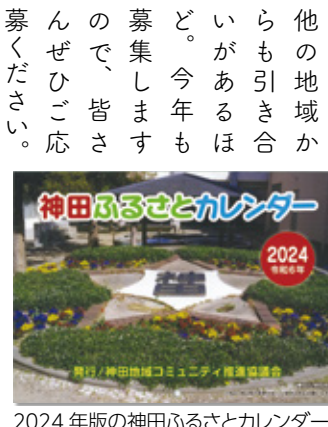
2024年版の神田ふるさとカレンダー

毎年、地域にお住まいの方が撮られた神田の風景や行事などの写真を募集してカレンダーを制作し、地域内全戸に配布しています。これがとても好評で、他の地域からも引き合いがあるほど。今年も募集しますので、皆さんぜひご応募ください。