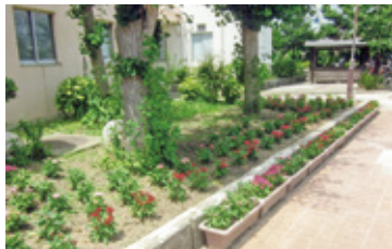
神田小学校で育てている花苗

神田地域には連合町会という町会・自治会の連合体があり、地域がうまく一つにまとまっているのが特長です。自主防災会にも全町会・自治会が参加しており、連携が取りやすい体制になっています。本協議会は設立当初から「安全・安心・美化」をテーマとして、さまざまな事業に取り組んできました。街路灯、防犯カメラ、道路のグリーンベルトや防護柵、掲示板、AEDといったハードの整備、ボランティアの方々を中心とした「安全パトロール隊」、愛犬にワッペンを付けて散歩していただく「わんわんパトロール」、そして神田小学校の3年生と一緒に花苗を育てて地域に配布する「花いっぱいプロジェクト」など、皆さんのご協力を得て、