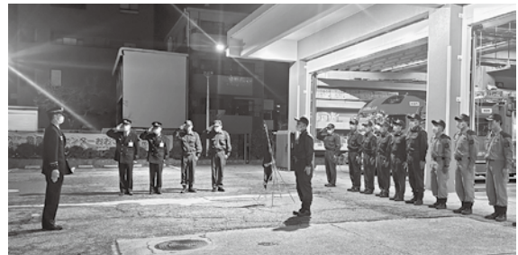
1月5日(金)緊急消防援助隊大阪府大隊への消防職員派遣の出発式の様子