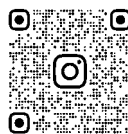
石橋阪大前駅周辺 まちづくり協議会 Instagram

時 3月24日(日)午前10時～午後3時(雨天中止) 場 石橋駅前公園 内 芝生広場の設置やワークショップ大会、飲食ブースなど ※詳細は石橋阪大前駅周辺まちづくり協議会 Instagramをご覧ください。