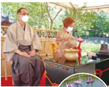
きれいに咲く花菖蒲の横で行われる花菖蒲まつりの野だて (写真上)

花の名所として知られる水月公園で例年6月10日前後の土・日曜日に行われる「花菖蒲まつり」親と子の集い」は池田の初夏の風物詩であり、市内外から約1万人が訪れます。その催しの一つである「野だて」