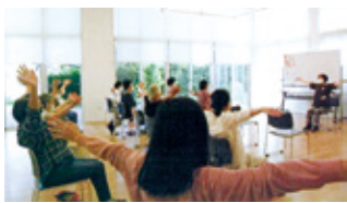
認知症予防講座の様子

「認知症予防講座」は実施して7年になります。家族の中で認知症の方がおられると皆さまが大変な思いをされます。認知症の理解不足もありますが、まさか、自分の両親がとの思いがあります。講座を開催することにより、みんなで楽しく体操をして、食の大切さを知り、仲間もでき、健康で過ごすことができると思います。講座を開催していく中で