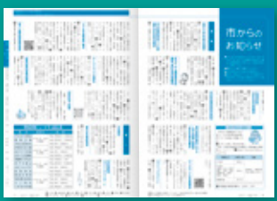
2色刷りだったお知らせ情報のページが...

横書きに合わせ、左綴じ・左開きに。ファイリングのための穴もなくて、誌面にゆとりが生まれたよ