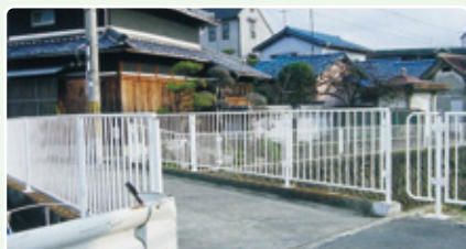
転落防止柵の設置