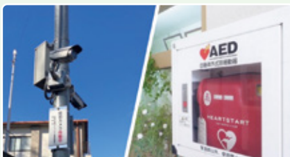
防犯カメラ / AEDの設置