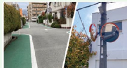
グリーンベルト / カーブミラーの設置