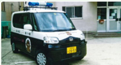
安全パトロール活動