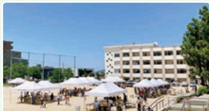
地域イベントの開催