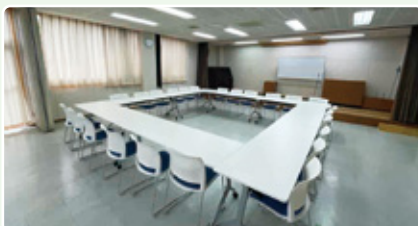
公共設備品の更新