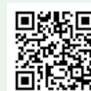
▲同館ホームページ

【問合せ】総合スポーツセンター ☎761・5137、夫婦池公園テニスコート ☎751・1400、五月山体育館 ☎750・2430