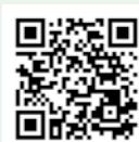
▲同テニスコートホームページ