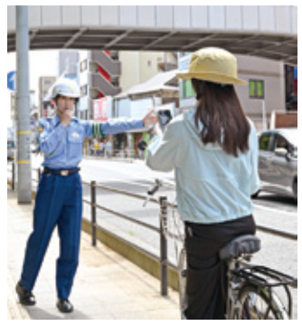
自転車の違反者を呼び止めて注意する場面をイメージし、表紙にしました。