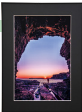
◀市長賞「洞窟から望む夕日」