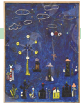
市長賞「テーマパーク」▶