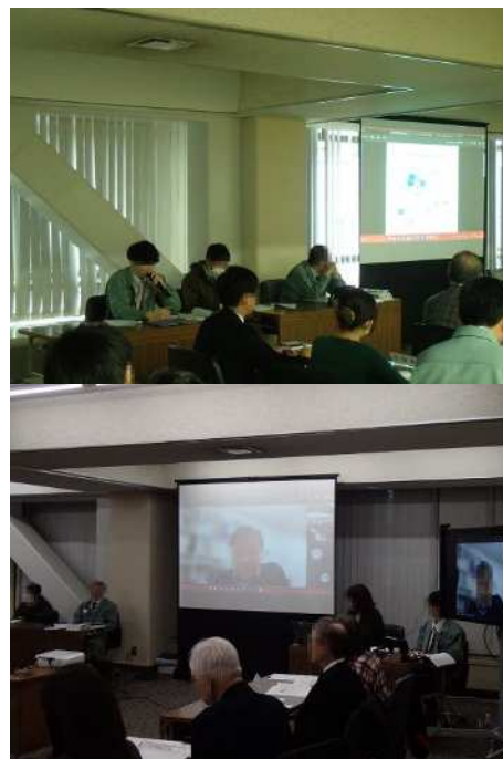
図 資-2-4 当日の様子