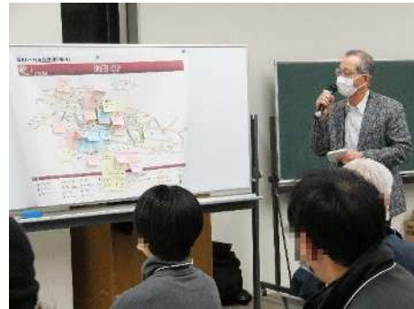
新田先生の講評の様子