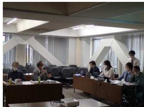
図 資-2-1 当日の様子