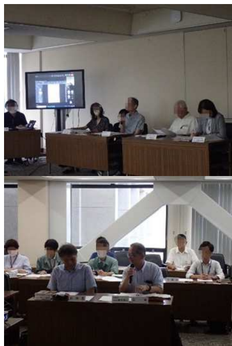
図 資-2-3 当日の様子