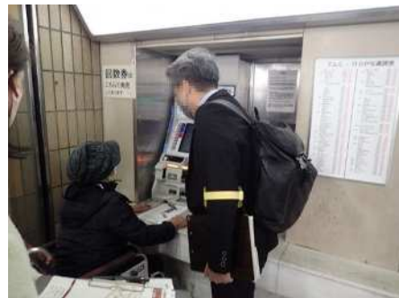
駅の券売機の点検