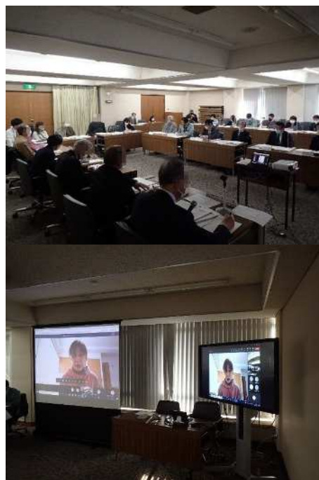
図 資-2-2 当日の様子