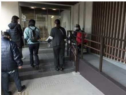
施設入り口のスロープや階段の点検

生活関連施設や生活関連経路のバリアフリー化の状況や、案内のわかりやすさ、施設の使いやすさなどについて、次項の点検ルート図に示す3ルートについて、それぞれ点検を行った。