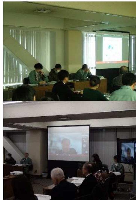
図 資-2-2 当日の様子