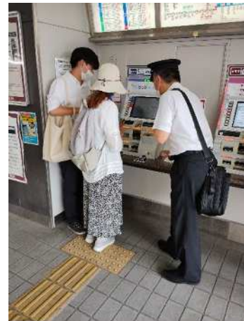
駅の券売機の点検