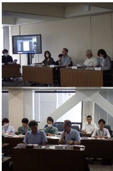
図 資-2-1 当日の様子