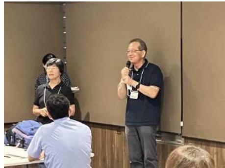
新田先生の講評の様子