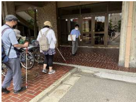
施設入り口のスロープや階段の点検

生活関連施設や生活関連経路のバリアフリー化の状況や、案内のわかりやすさ、施設の使いやすさなどについて、次項の点検ルート図に示す3ルートについて、それぞれ点検を行った。