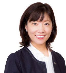
池田市長 瀧澤 智子

最後に、本計画策定にあたりまして、市議会、総合計画審議会、市民意識調査やワークショップ、パブリックコメント等を通じて貴重なご意見をお寄せいただいた皆さまに心より感謝申し上げますとともに、めざすまちの将来像の実現に向けた市政運営及び皆さまとの協働の推進につきまして、なお一層のご理解とご協力をお願い申し上げます。