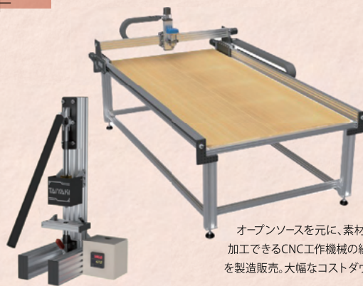
オープンソースを元に、素材を思い通りに加工できるCNC工作機械の組み立てキットを製造販売。大幅なコストダウンに成功!

既存のオープン技術や試作機を製品化し世界中に届ける自社プロダクト販売と、ハードウェアのオープンソースコミュニティを運営し、技術公開と相互フィードバックによって製品を進化させる事業を展開。