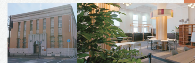
いけだピアまるセンター 外観

ながら開業したり、豊富な人生経験を生かして次世代を育てたり、自由度を生かしてワークバランスを模索したり。デジタル化が進み、様々な仕事のやり方が提唱される今をチャンスと捉えて、自己実現のためにも様々な挑戦をしていただきたいですね。時代の変化に柔軟な女性の創業にも期待しています。