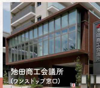
池田商工会議所 (ワンストップ窓口)

※池田商工会議所窓口への直接のお問い合わせは、必ず事前にお電話でご予約ください。