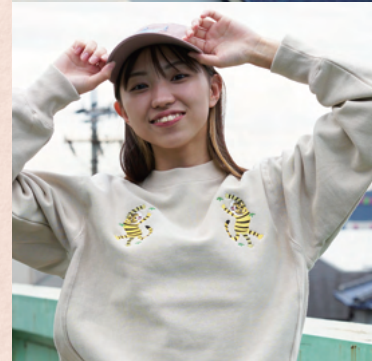
「ストーリーが感じられるような、コミュニケーションが生まれるような、そんなアパレルを作りたい」との思いからモチーフデザインに徹底的にこだわり、さまざまなアイテムを誕生させている。