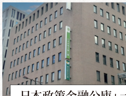
日本政策金融公庫十三支店