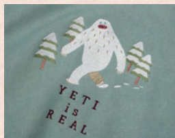
「超常現象シリーズ」の新作「イエティ」がネットで大反響!

ちょっと変わったシュールなデザイン刺繍を施したアパレルを製造、SNSを中心に発信してネット販売しています。育児期間中に副業を考えていた時に商工会議所のチャレンジコンテストを知って「応募しよう」と思ったのが本腰を入れるきっかけになりました。「イエティ」の刺繍をあしらったアイテムがSNSでバズり、ネットニュースになって人気が出てきて、今では本業としてやっています。手探りで始めましたが、最初のハードルを1歩超えてしまえば、後は結構一気に進むなという実感がありました。創業スクールでは地域貢献に力を入れている方が多くて触発されましたね。今は、路面店のオープンに向けてお祝いグッズや保育園グッズの構想中。「ここに刺繍してもらおうかな」と、気軽に入れて楽しめるお店にしたいですね。