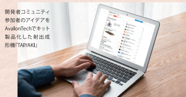
開発者コミュニティ参加者のアイデアをAvalonTechでキット製品化した射出成形機「TAIYAKI」

オープンソースハードウェアを検証しを検証し高めあう開発者コミュニティ「OSHW」では活発な議論が日々交わされている。