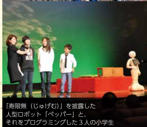
「寿限無(じゅげむ)」を披露した人型ロボット「ペッパー」と、それをプログラミングした3人の小学生