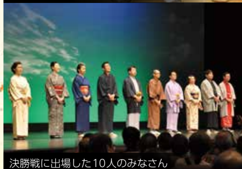
決勝戦に出場した10人のみなさん