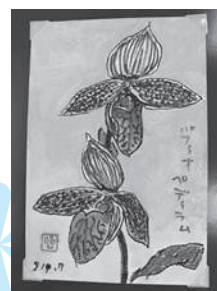
最優秀作品「パフィオペディラム」