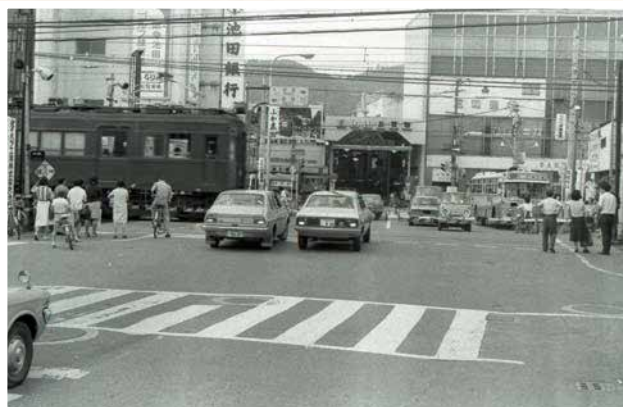
▲栄町商店街前の踏切（昭和51年） ※池田駅の高架化前。