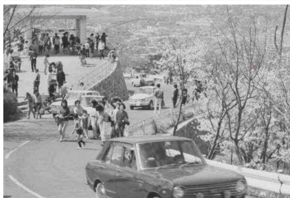
▲五月山の秀望台付近（昭和42年）