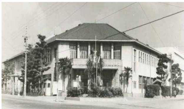
▲旧池田市庁舎（昭和37年） ※現・池田駅前公園

本市は、1939（昭和14）年に池田市制が施行され、大阪府で6番目、人口3万5,494人として、池田市80年のあゆみが始まりました。