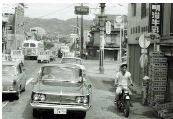
▲石橋阪大下交差点（昭和41年） ※国道176号からの風景。