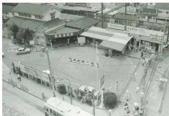
▲池田駅前ロータリー（昭和49年）