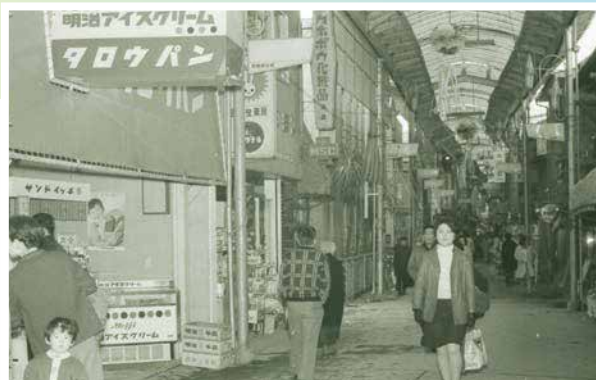
▲石橋商店街（昭和43年） ※アーケード南端から北向き。