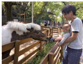
「危機一髪!」五月山動物園