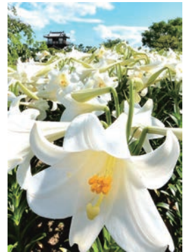
「女官演舞」池田城跡公園

※掲載内容は、7月10日時点の情報であり、新型コロナウイルス感染症拡大防止のため、変更となる可能性があります。市民文化会館のホームページでご確認ください。