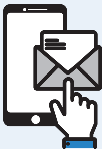
メールアドレスを入力 または空メール送信