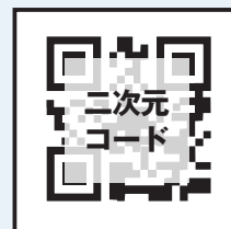
二次元コードを印刷・掲示