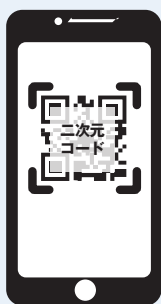
利用施設・イベント先で 二次元コード読み込み