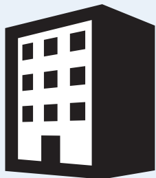
施設・イベント情報を登録