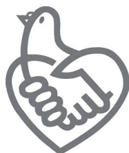
条例啓発 シンボルマーク

内 狭間池住宅1階(旭丘3・7。間取り3K) 対 車椅子常用者(身障手帳1級または2級)で同居する親族がいて、収入基準に合う方 定 1戸 申 10月16日(金)までに障がい福祉課 ☎754・6255 ※申し込み多数の場合は抽選。家賃は収入基準によります。