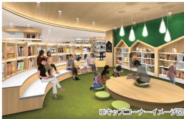
※キッズコーナーイメージ図

新たな図書館は、従前と比べて開館日を拡大、月1回の整理日と年末年始を除いて、毎日開館します。開館時間も午後8時まで延長し(日曜日・祝日を除く)、仕事や学校帰りにも利用しやすくなります。