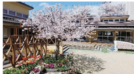
市立さくら幼稚園

幼稚園型認定こども園への移行の進捗状況などについては、随時お知らせします。教育委員会として、今後も幼児教育推進に努めますのでご理解とご協力をよろしくお願いいたします。