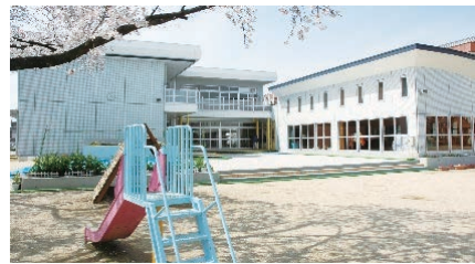
市立あおぞら幼稚園