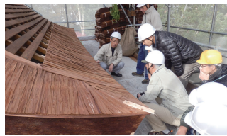
昨年の本殿修理見学の様子

天正7(1579)年に織田信長の兵火で焼失しましたが、慶長15(1610)年、池田氏の末裔、他紋丸により再建されたものです。一間社流造で、欄間などに桃山時代の特色がよく残されている貴重な建造物であり、北摂では数少ない遺構です。2年間にわたる保存修理が完了し、今回は、修理作業用の足場から間近に建物を見ることができ、貴重な機会です。