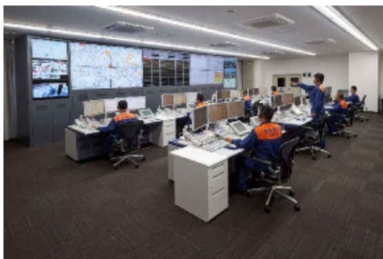
豊中市・池田市消防指令センター

平成27年4月に池田市と豊中市は、豊中市消防局 北消防署 東泉丘出張所内に消防資源を効果的に活用した「豊中市・池田市消防指令センター」を開設し、消防業務の効率的な運用を図るため消防防災情報システムを更新整備し、消防指令業務の共同運用を開始しました。