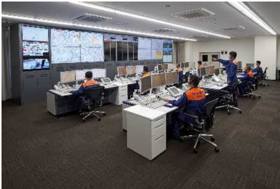
豊中市・池田市消防指令センター

平成 27 年 4 月に池田市と豊中市は、豊中市消防局 北消防署 東泉丘出張所内に消防資源を効果的に活用した「豊中市・池田市消防指令センター」を開設し、消防業務の効率的な運用を図るため消防防災情報システムを更新整備し、消防指令業務の共同運用を開始しました。