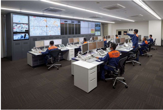
（豊中市・池田市消防指令センター）

平成 27 年 4 月に池田市と豊中市は、豊中市消防局 北消防署 東泉丘出張所（現在は新千里消防署管内）内に消防資源を効果的に活用した「豊中市・池田市消防指令センター」を開設し、消防業務の効率的な運用を図るため消防防災情報システムを更新整備し、消防指令業務の共同運用を開始しました。