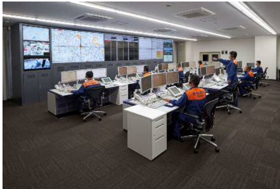
豊中市・池田市消防指令センター

平成27年4月に池田市と豊中市は、豊中市消防局 北消防署 東泉丘出張所内に消防資源を効果的に活用した「豊中市・池田市消防指令センター」を開設し、消防業務の効率的な運用を図るため消防防災情報システムを更新整備し、消防指令業務の共同運用を開始しました。