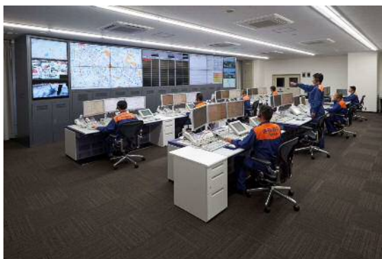
(豊中市・池田市消防指令センター)

平成 27 年 4 月に池田市と豊中市は、豊中市消防局 北消防署 東泉丘出張所（現在は新千里消防署管内）内に消防資源を効果的に活用した「豊中市・池田市消防指令センター」を開設し、消防業務の効率的な運用を図るため消防防災情報システムを更新整備し、消防指令業務の共同運用を開始しました。