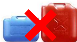
ガソリンの貯蔵に適さない容器の例 (樹脂製容器は火災危険性が高い)