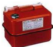
ガソリンの貯蔵に適した容器の例 (金属製容器であることが必要)