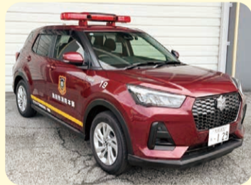
司令車(19号車) 寄贈者：池田市消防協会

消防・救急体制の充実強化のため、みなさまからの温かいご寄付を心よりお待ちしております！