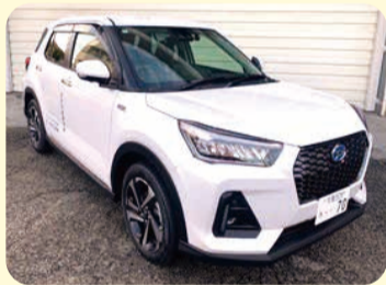
乗用車(ダイハツ ロッキー) 寄贈者：ダイハツ工業株式会社