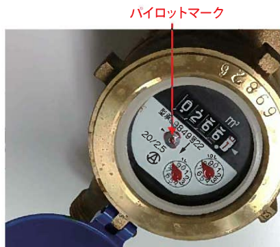
パイロットマーク

家の中で漏水が起きていないかどうか、簡単に確認する方法があります。家中の蛇口を全て閉めてから、*水道メーターのパイロットマーク(写真参照)を確認してください。わずかでもゆっくりと回っていたら、どこかで水が漏れている可能性があります。「もしかして、漏水かな?」と思ったら、池田市指定管工事協同組合(TEL:072-750-6388)又は、池田市指定給水装置工事事業者までご連絡ください。