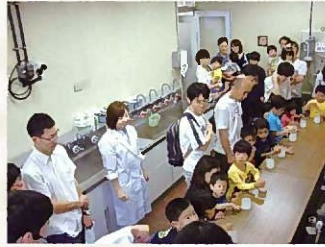
体験型おもしろ 実験の様子

6月4日(月)～7日(木)の間、市役所に市内小学生の「水」をテーマにした書道作品を展示しました。