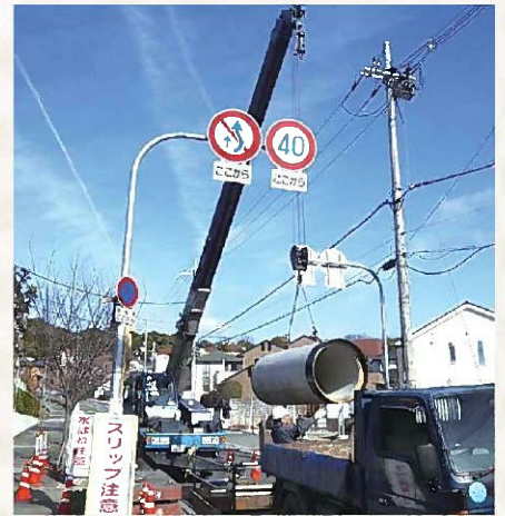
雨水排水施設の整備

安全・安心で快適なまち「災害に強いまち池田」を目指して、今後も雨水施設の整備を促進してまいります。