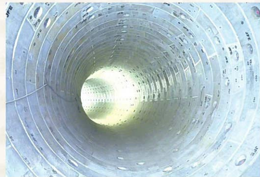
雨水を貯める施設(石橋第1増補幹線)