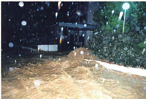
平成6年の集中豪雨であふれる荒堀川