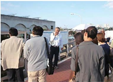
昨年の施設見学の様子