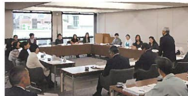
いろいろなお意見をいただきました