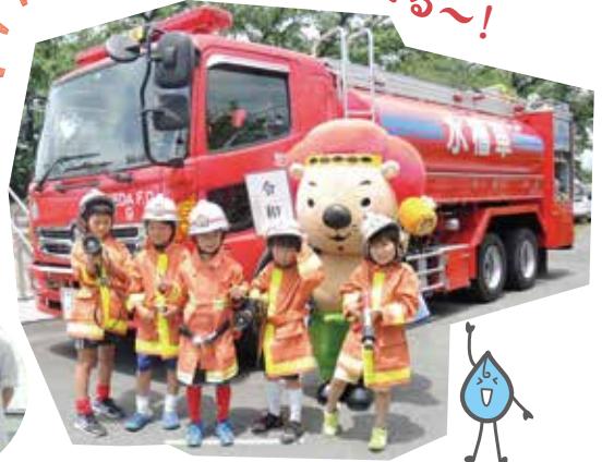
ポンプ車前記念撮影