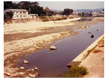
昭和53(1978)年渇水時の猪名川の様子

夏のこの時期は、年間を通じて水の使用量が最も多く、 渇水時には水不足が生じることもあります。 この時期をきっかけに普段の暮らしの中で、 限りある水資源について考えてみませんか？