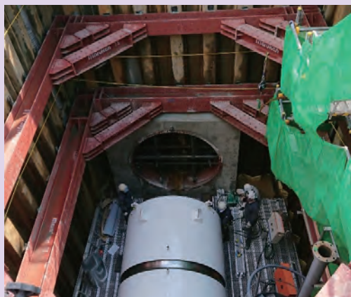
●雨水貯留施設のトンネルを掘る機械