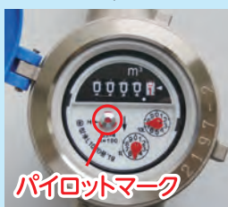
パイロットマーク

家中のじゃ口を全て閉めてから、水道メーターの パイロットマーク を確認してください。わずかでも回っていたら、どこかで水が漏れている可能性があります。もしかして漏水かな？と思ったら、池田市指定管工事協同組合(072-750-6388)までご連絡ください。